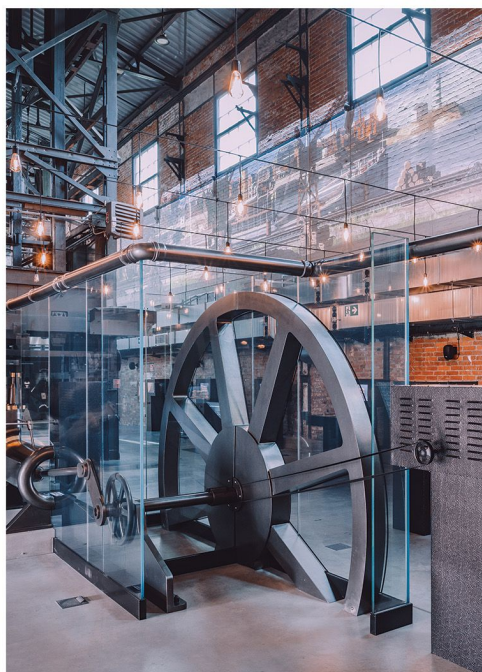
Wystawa "Wiek Pary" w nadszybiu Szybu Kościuszko