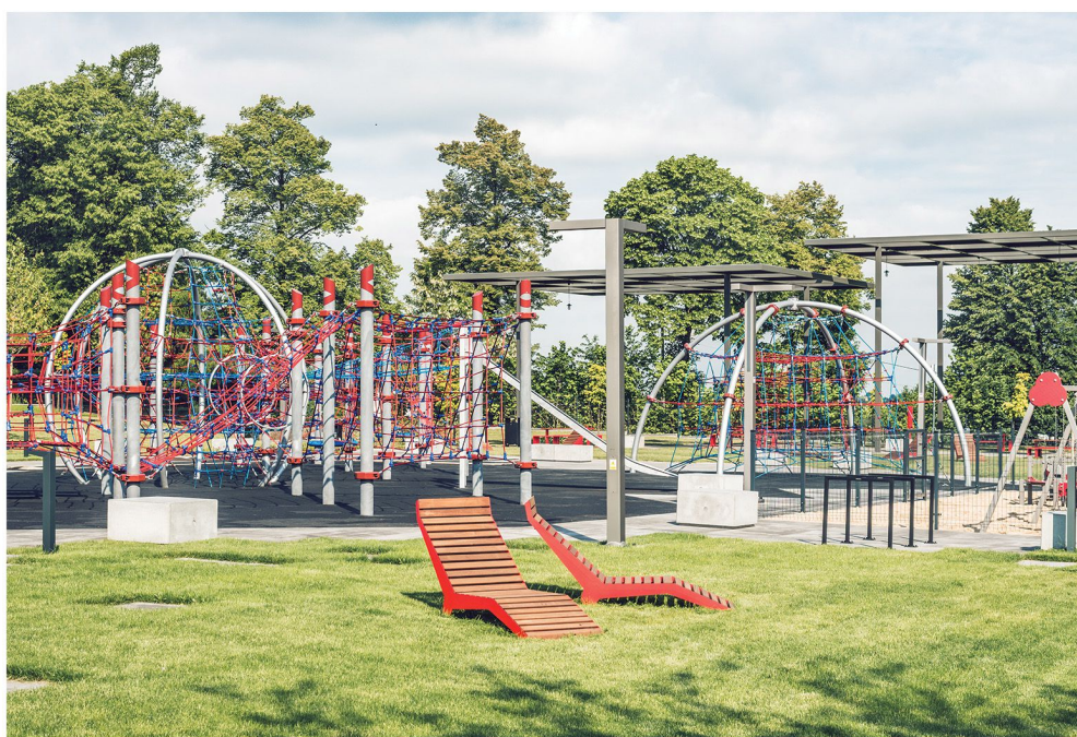
Park Pary - industrialny plac zabaw