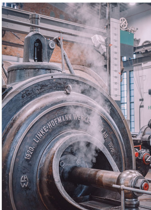
100-letnia maszyna wyciągowa o napędzie parowym

Dawna kopalnia Ignacy nie wydobywa i nie przetwarza już węgla kamiennego. Dziś jako Zabytkowa Kopalnia Ignacy po kilkuletniej rewitalizacji pełni nowe funkcje. Tu opowiadamy przemysłowe historie, ucząc szacunku dla tradycji naszego regionu. Staramy się rozbudzać wśród dzieci ciekawość świata. Jesteśmy zadbany zabytkiem techniki, miejscem mądrej rozrywki i rekreacji.