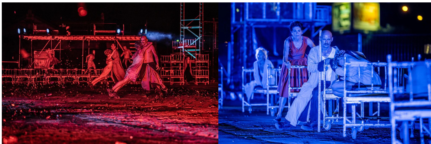
Spektakl Ślepcy Teatru KTO, Fot. z arch. P.Chlipalskiego

Od 1 czerwca ruszyła sprzedaż biletów na wystawę "Wiek pary" wraz z pokazami pracy maszyny parowej. Bilety do nabycia na stronie internetowej Kopalni i w kasach w cenie 10 zł od osoby.