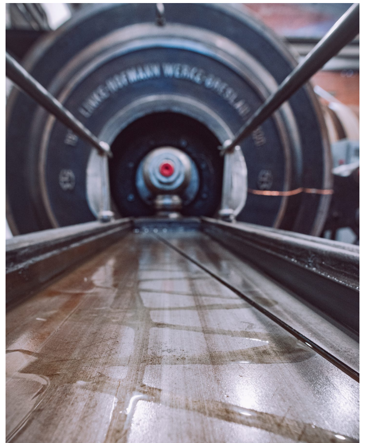
Tłok maszyny parowej, fot. M.Locher, Zabytkowa Kopalnia Ignacy