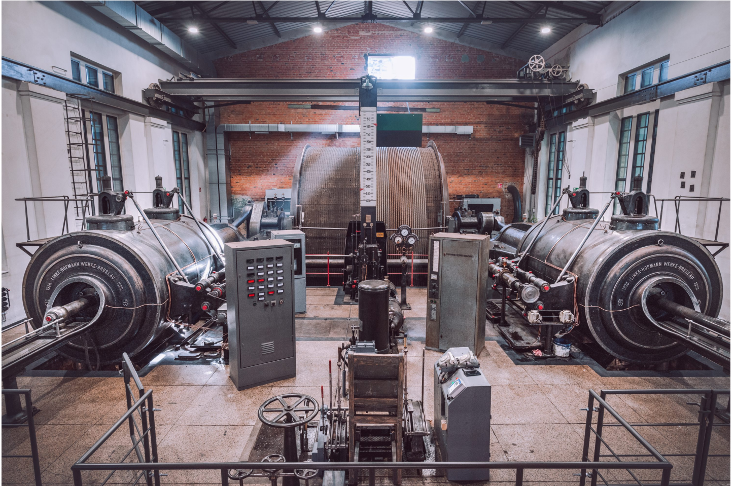
Maszyna wyciągowa Szybu Kościuszko

Ponad stuletnia maszyna wyciągowa Szybu Kościuszko została ponownie uruchomiona przez byłych pracowników kopalni. Dziś stanowi ona najważniejszy eksponat wystawy „Wiek pary”. Choć historia kończy się szczęśliwie, po zamknięciu kopalni jej przyszłość nie rysowała się w jasnych barwach. Uratowano ją dzięki odwadze pasjonatów i determinacji samorządu Miasta Rybnika.