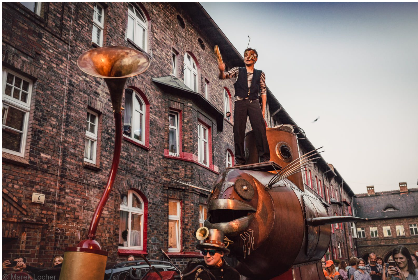
Teatr Gry i Ludzie

Zabytkowa Kopalnia Ignacy rusza pełną parą w sobotę, 4 czerwca. W 230 roku od założenia dawna Hoymgruba zyskuje drugie życie, a serce kopalni ponownie zabije. Specjalnie przygotowany na ten dzień festiwalowy program trafi w gusta każdego.