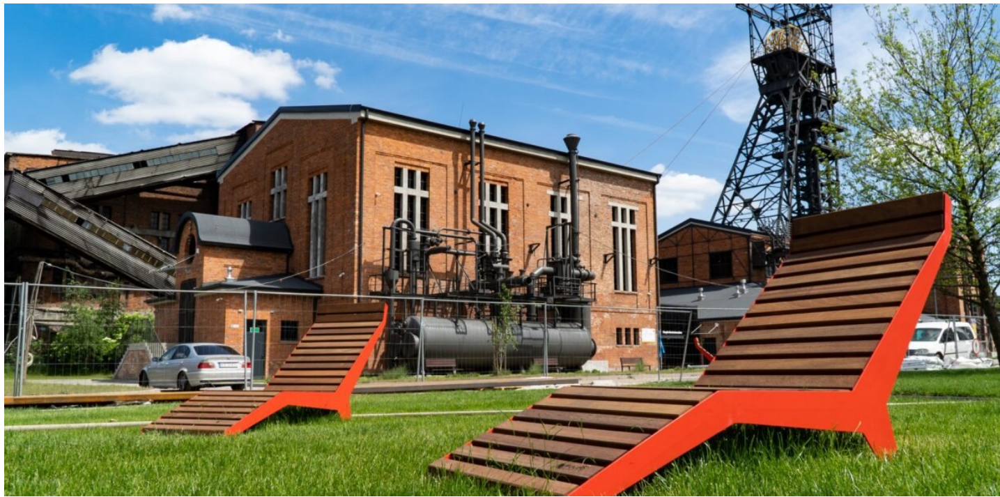
Park pary, fot. M.Koczy, Urząd Miasta Rybnika

W cieniu dwóch wież szybowych, na obszarze ponad 1 powstał wyjątkowy teren wypoczynkowo-rekreacyjny. Przestrzeń ogólnodostępna dedykowana społeczności lokalnej. Po przyjęciu sporej dawki wrażeń odpoczną tu także zwiedzający Zabytkową Kopalnię Ignacy.